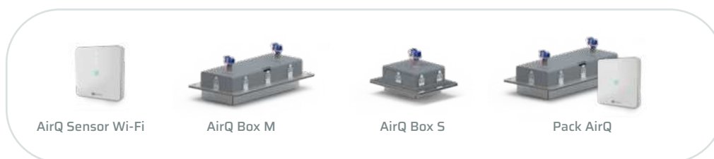
AirQ Sensor Wi-Fi